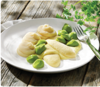
Torsktimbal med senapssås, ärtimbal & potatismos, 76411