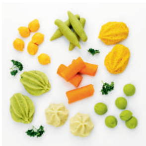
Grönsakstimbal sortimentslåda (2,40 kg), 7 st olika sorter.