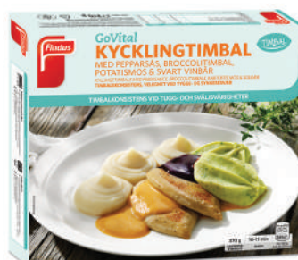
40631 Kycklingtimbal med pepparsås