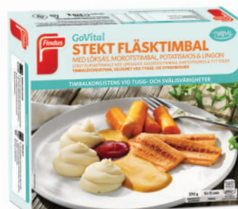
51349 Stekt fläsktimbal med löksås