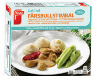
61069 Färsbullstimbal med gräddsås