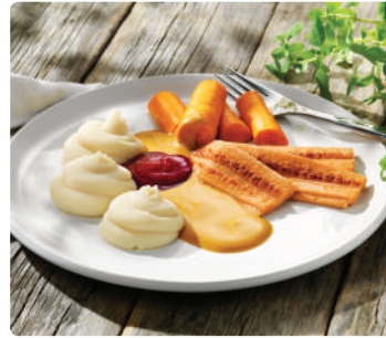
Stekt fläsktimbal med löksås, morottstimbal, potatismos & lingon, 51349