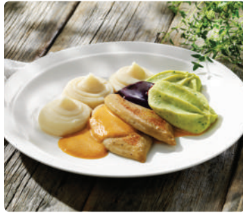
Kycklingtimbal med pepparsås, broccolitimbal, potatismos & svart vinbär, 40631