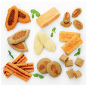
Kött- och fisktimbal sortimentslåda (2,45 kg), 9 st olika sorter.

Med Findus sortimentslådor kan du enkelt skapa fler smakfulla måltider.