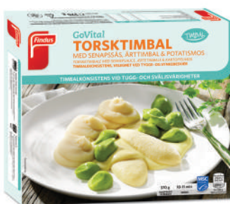
76411 Torsktimbal med senapssås

The role of malnutrition in older persons with mobility limitations http://www.ingentaconnect.com/content/ben/cpd/2014/00000020/00000019/art00008