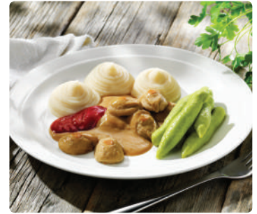
Färsbullstimbal med gräddsås, böntimbal, potatismos & lingon, 61069